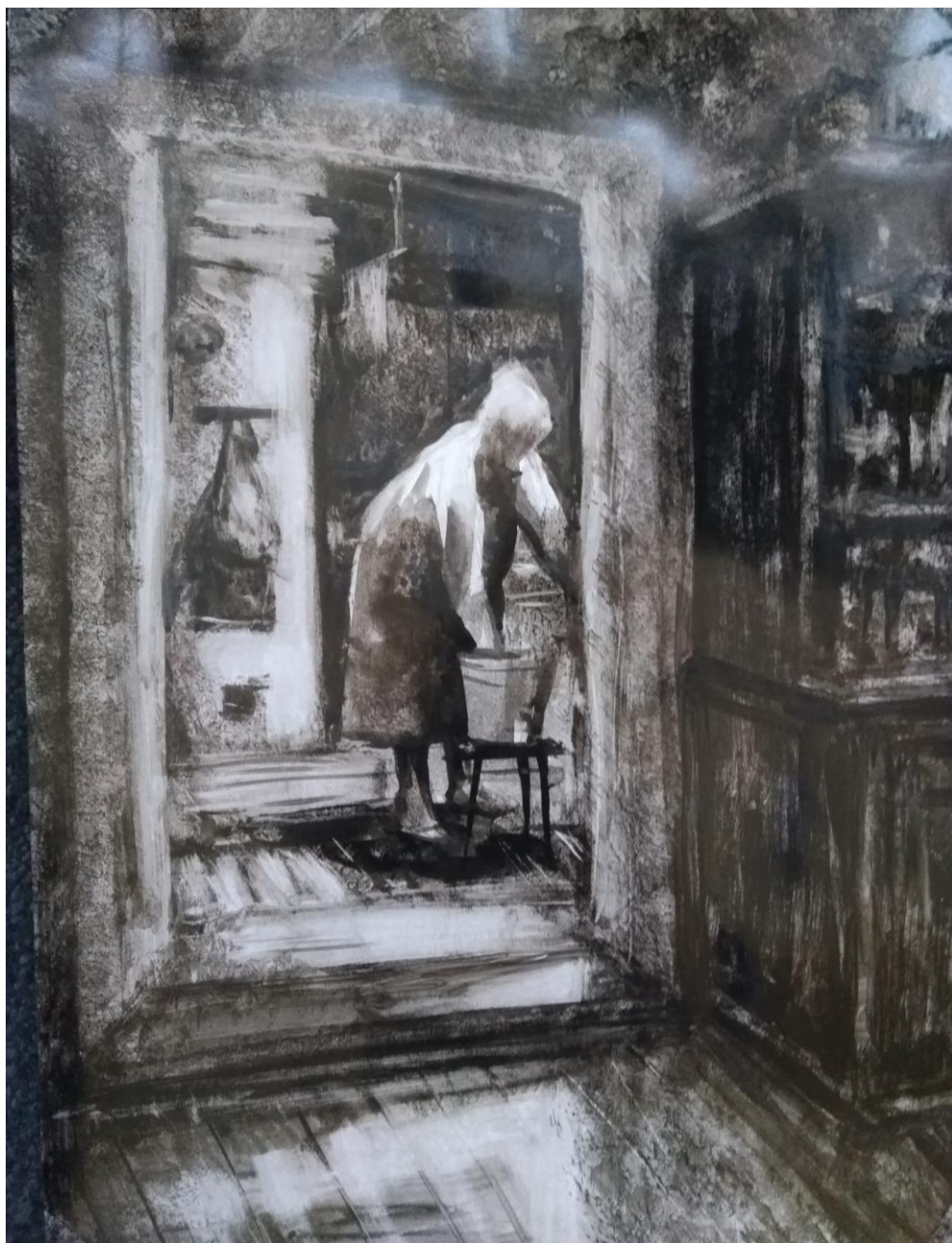
М. Гусян «В доме родном», рисунок с натуры