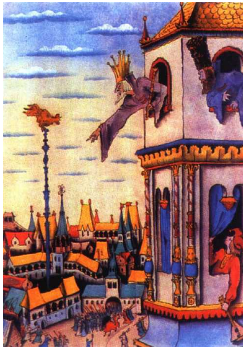
Художник Конашевич, 1949

Но лишь чуть со стороны Ожидать тебе войны, Иль набега силы бранной, Иль другой беды незванной, Вмиг тогда мой петушок Приподымет гребешок, Закричит и встрепенется И в то место обернется».