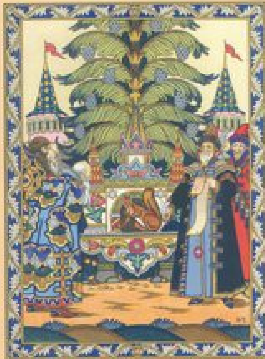
Художник Борис Зворыкин